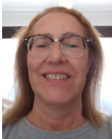
Presidente Ana Isabel Higino Figueiredo Gonçalves